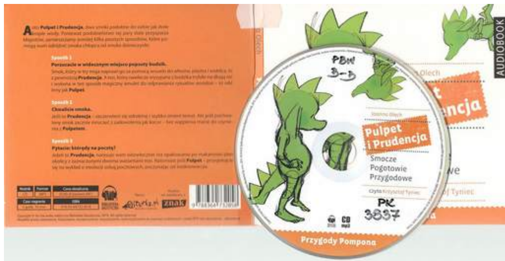
Pulpet i Prudencja : [Płyta komp.] Smocze Pogotowie Przygodowe / Joanna Olech ; czyta Krzysztof Tyniec. - Warszawa : Biblioteka Akustyczna ; we współpr. z Znak. syg. PK 3837

Pompon, słynny smok przygarnięty przez rodzinę Fisiów, ożenił się i ma dwoje dzieci. Są to bliźniaki Pulpet i Prudencja. Chodzą do zwykłej szkoły z dziećmi, które je zaakceptowały i wcale się nie dziwią, że w ławce siedzą dwa bystre smoki w kolorze limonkowym. Pewnego dnia Pulpet i Prudencja wybierają się z przyjaciółmi do Transylwanii w poszukiwaniu swoich przodków... Fantastyczne poczucie humoru i wartka akcja!