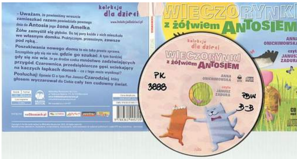
Wieczorynki z żółciem Antosiem [Płyta komp.] / Anna Onichimowska ; czyta Janusz Zadura. - Warszawa : Biblioteka Akustyczna, 2010. syg. PK 3888